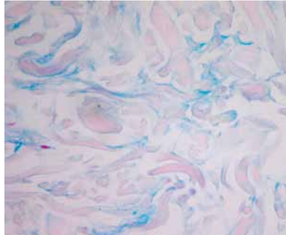
FIGURA 2. Depósitos de mucina presentes en la superficie del colágeno. Azul alciano. 40 x.

con fibras de colágeno edematosas y separadas unas de otras ( FIGURA 1 ). Con tinciones especiales para mucina (azul alciano, hierro coloidal), se demostró el incremento en el depósito de ésta en pequeñas cantidades en el espacio dejado entre las fibras de colágeno ( FIGURA 2 )