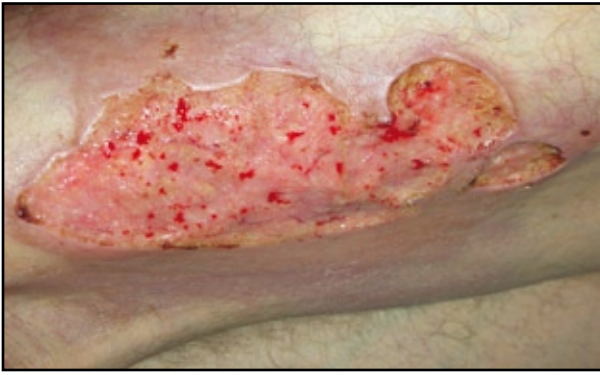
FIGURA 1: Úlcera de gran tamaño en el muslo izquierdo.