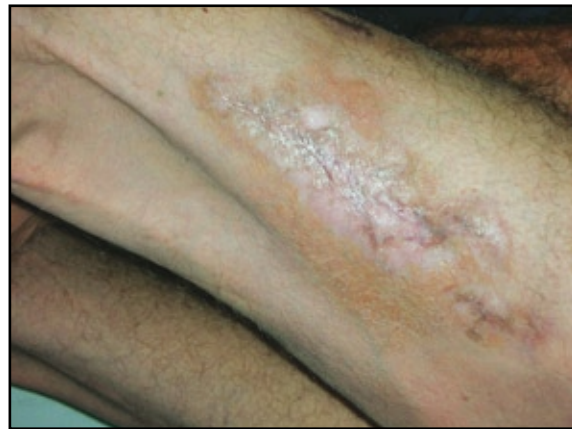
FIGURA 4: Cicatrización total de la úlcera en el muslo izquierdo, seis meses después del tratamiento.

encontraron nódulos pulmonares, el de mayor tamaño estaba cavitado y tenía pared delgada; meningitis crónica e hidrocefalia comunicante activa; antígeno para criptococo sérico y en LCR positivos (dilución 1:256 y 1:64 respectivamente), cultivos positivos para Cryptococcus neoformans en muestras de lavado bronco alveolar y LCR, lo cual sumado al hallazgo del estudio histopatológico (FIGURA 2 Y 3) de las lesiones cutáneas confirmaron el diagnóstico de criptococosis diseminada.