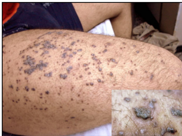
FIGURA 1. Pápulas violáceas de base eritematosa y superficie verrugosa en el muslo derecho.