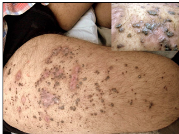
FIGURA 3. Áreas cicatriciales con hipopigmentación central y periferia hiperpigmentada después de tratamiento con crioterapia.

Con base en los hallazgos clínicos y paraclínicos, sumados a los conceptos de de las interconsultas, se hizo un diagnóstico definitivo de angioqueratomas nevoides circunscritos o enfermedad de Fabry tipo II sin compromiso sistémico. Previa explicación de las posibilidades de tratamiento existentes y sopesando preferencias, costos, riesgos y beneficios, se decidió un tratamiento inicial con la realización de dos sesiones de criocirugía cada seis semanas. Los resultados iniciales han sido favorables; se obtuvo la resolución de las lesiones tratadas, con un área hipopigmentada residual inicial ( FIGURA 3 ), por lo cual se intentará ahora un segundo tratamiento de prueba en otras lesiones mediante fulguración por radiofrecuencia.