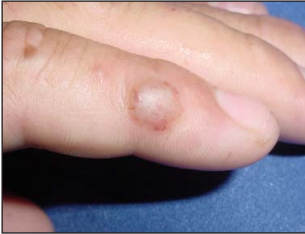
FIGURA 1. Fase inicial clínica del nódulo del ordeñador