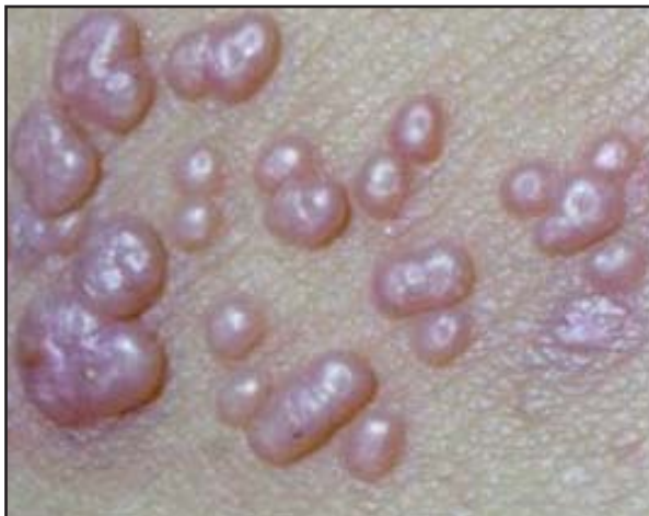
FIGURA 3. Lesiones múltiples de molusco contagioso en paciente inmunosuprimido.