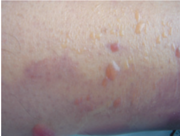
Figura 1. Livideces en miembros inferiores