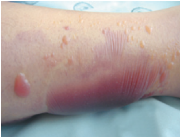
Figura 2. Formación de vesículas y ampollas tensas por necrosis epidérmica

clindamicina y cefepime. Los paraclínicos mostraron una marcada leucocitosis: 130.000/\text{mm}^3 , con blastos de 95%, segmentados de 2%, cayados de 1%, hemoglobina de 8 y hematocrito de 25%. El deterioro general de la paciente se hizo evidente en pocas horas y presentó signos de dificultad respiratoria, palidez y taquicardia; la paciente falleció a las 24 horas del ingreso por falla multiorgánica.