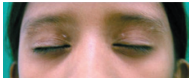
Figura 4. Sexto mes de tratamiento: repigmentación importante de lesiones de vitíligo