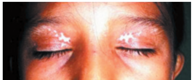
Figura 3. Cuarto mes de tratamiento: repigmentación parcial de lesiones.