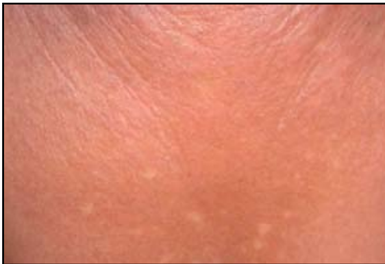
FIGURA 3: DRESS. Erupción eritemato papulosa, confluyente, con infiltración edematosa.