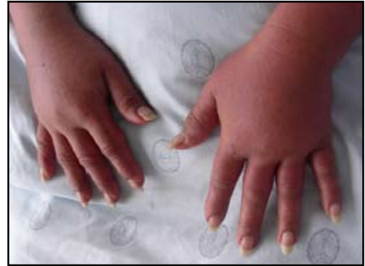
FIGURA 2: DRESS. Edema de las manos.