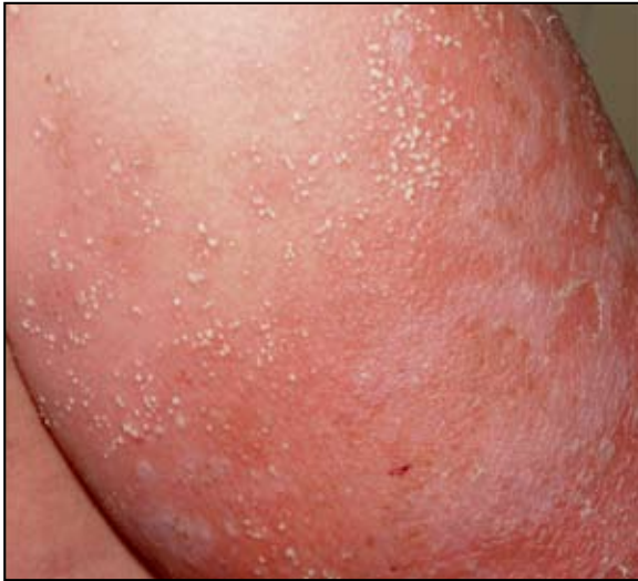
FIGURA 3: Numerosas pústulas no foliculares menores de 5 mm de diámetro en el brazo izquierdo.