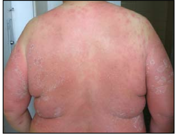
FIGURA 2: Placas eritematoedematosas en el tronco posterior con micropústulas superficiales.