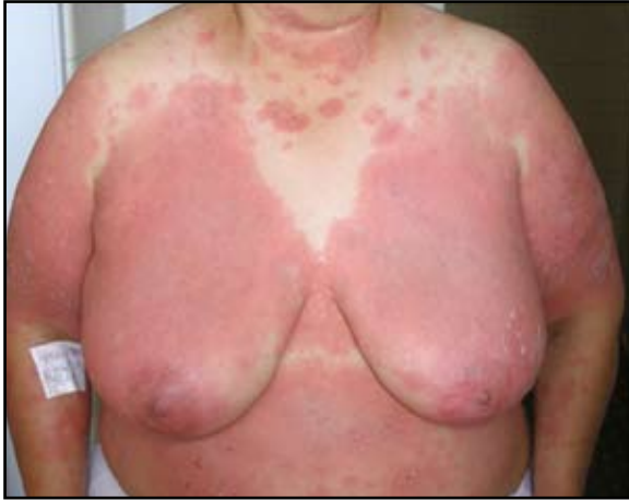
FIGURA 1: Placas eritematoedematosas mal definidas en el tronco anterior.