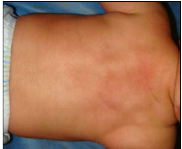
FIGURA 3. Evolución de las lesiones clínicas a las 6 semanas de vida.

En los exámenes paraclínicos se encontró trombocitopenia (plaquetas entre 33.000 y 150.000/mm 3 ) y anemia persistentes (hemoglobina mínima de 6,8 g/dl); además, hipercalcemia leve con calcio sérico de 10,8 (valores de referencia, 8,5 a 10 mg/dl); VIH, negativo; VDRL materno, negativo; IgM para toxoplasma e IgM