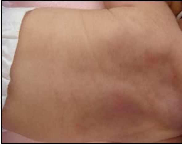
FIGURA 1. Placa eritematosa, indurada, sin fóvea, de 6 cm x 5 cm, con nódulos palpables, localizada en la región superior de la espalda